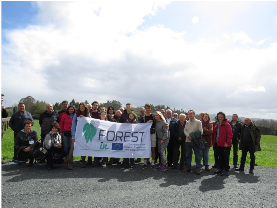
Participants à la formation